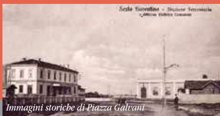
Immagini storiche di Piazza Galvani