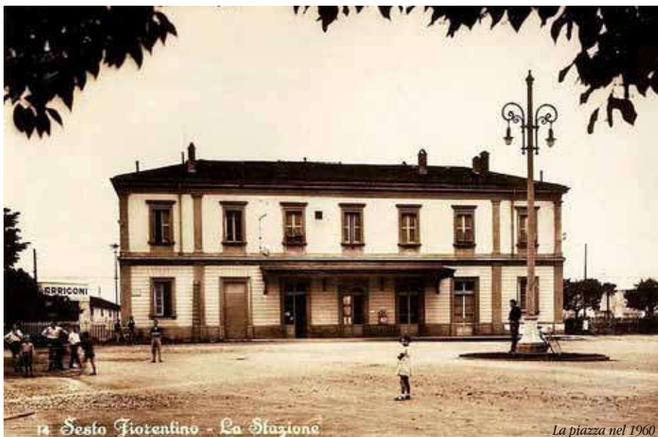
14 Sesto Fiorentino - La Stazione