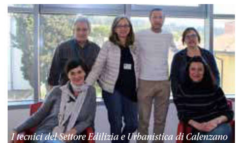
I tecnici del Settore Edilizia e Urbanistica di Calenzano

Per quanto riguarda invece la ricollocazione del volume mediante crediti edilizi, è in fase di approvazione il primo intervento, quindi siamo ottimisti e in attesa di valutare con più precisione il risultato finale.