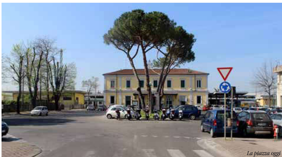
La piazza oggi

Tra il 1904 ed il 1905 la piazza venne intitolata a Luigi Galvani (n. 1737 - m. 1798) grazie al fatto che al limite